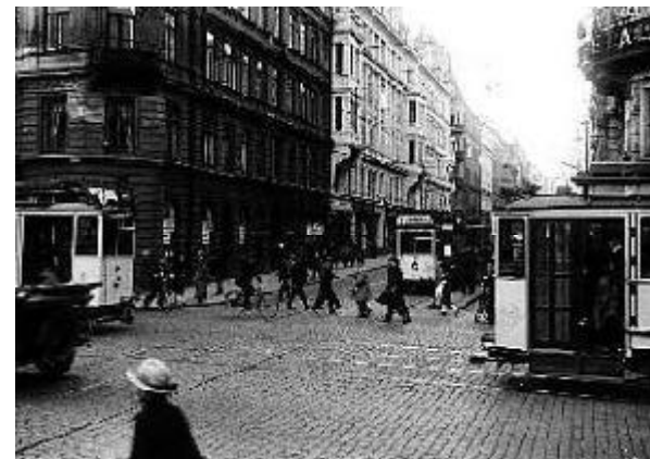
Korsningen Kungsgatan-Vasagatan år 1925, Stockholms första trafiksignaler har kommit på plats.

Enok stannar igen och svarar: “Det spelar ingen roll, det blir bara du och jag ...”